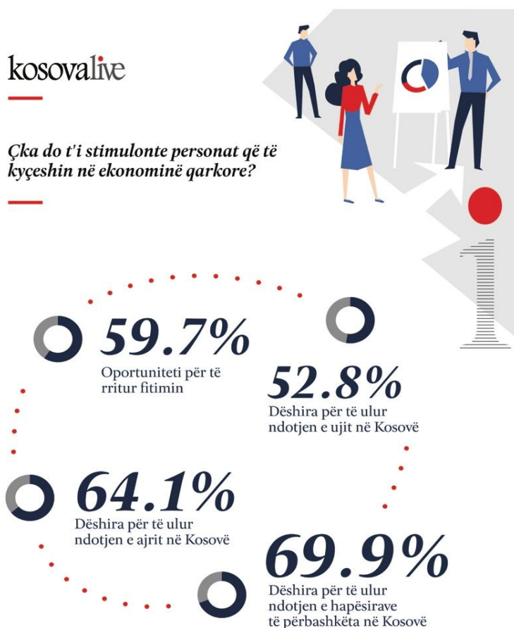
Grafikoni 3: Çka do t'i stimulonte personat që të kyçeshin në ekonominë qarkore?

Vetëm rreth 42% e banorëve të Kosovës, i ripërdorin ndonjëherë produktet e letrës, shishet dhe pajisjet e ndryshme të tjera. Rreth një e treta (34%) thonë se në përgjithësi ripërdorin produktet që janë të krijuara për një qëllim të caktuar, dhe një e katërta (24%) thonë se nuk i ripërdorin, pas përdorimit fillestar të tyre.